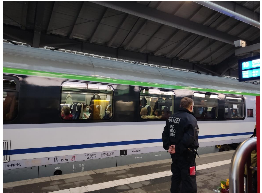
Kontrolle im Zug aus Polen in Frankfurt/Oder, 08.03.2022

legalisiert rückwirkend vom 24.02.-23.05.2022 die Einreise und den Aufenthalt aller Menschen, die aus der Ukraine fliehen